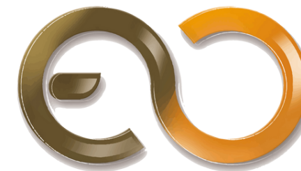
คณะสถาปัตยกรรมศาสตร์และการออกแบบ