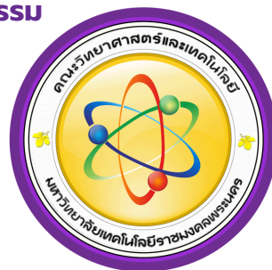
คณะวิทยาศาสตร์และเทคโนโลยี