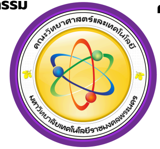
คณะวิทยาศาสตร์และเทคโนโลยี