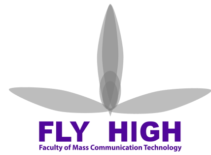
คณะเทคโนโลยีสื่อสารมวลชน