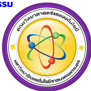
คณะวิทยาศาสตร์และเทคโนโลยี